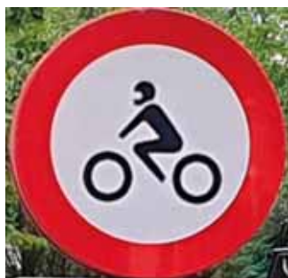
FIGUUR 3: VERKEERSBORD 'GESLOTEN VOOR MOTORFIETSEN'

Toelatingsbeleid , zoals milieuzones en wegafsluitingen, is al langer van kracht voor vrachtverkeer, maar is in opkomst voor gemotoriseerde tweewielers. In Amsterdam mogen sinds 2016 brom- en snorfietsen met bouwjaar vóór 2010 (vooral tweetakt) niet meer de milieuzone in, om reden van uitstoot en geluid. Dit wordt door andere gemeentes ook overwogen. Ook buiten de stad neemt de roep om rijverboden toe voor locaties waar veel hinder wordt gemeld.