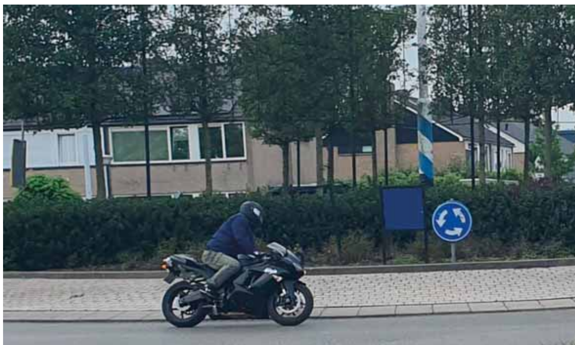
FIGUUR 1: MOTORFIETSEN ZIJN OOK BINNEN DE BEBOUWDE KOM EEN BRON VAN HINDER.

De hinder van gemotoriseerde tweewielers is welbekend. Vanwege het gebruikspatroon, het geluidniveau en de situaties met de meeste hinder zijn er verschillen tussen bromfietsen, scooters en motorfietsen. Waar bromfietsen vooral in stedelijke omgeving hinder veroorzaken, wordt door motorfietsen ook daarbuiten hinder veroorzaakt, onder andere langs tourroutes, in recreatie-