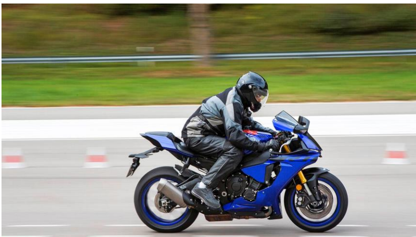
De Yamaha YZF-R1t in de waarnemersgeluidstest: 16 decibel luider dan de grenswaarde van 80 in een mum van tijd.

Sinds 2016 gelden er nieuwe geluidslimieten. Maar waarom zijn de klachten sindsdien toegenomen in plaats van afgenomen? Omdat motorfabrikanten en autoriteiten mensen met een geluidsbeperking bij de neus nemen.